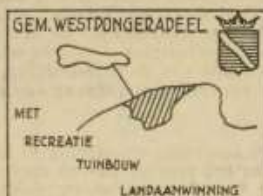
Frankeerstempel Westdongeradeel: „... met recreatie, tuinbouw, landaanwinning”.

Kampeerterrain Holwerd: re- delijke belangstelling